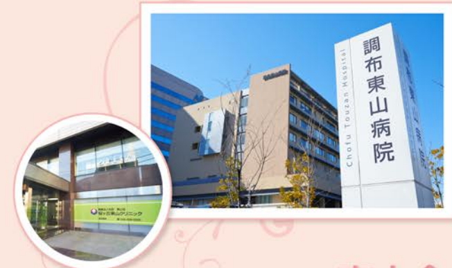
桜ヶ丘東山クリニック