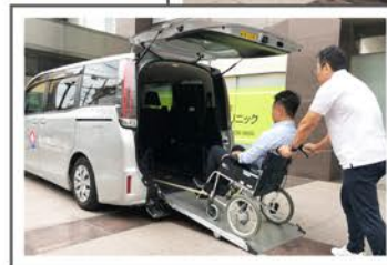
車椅子にも対応できます